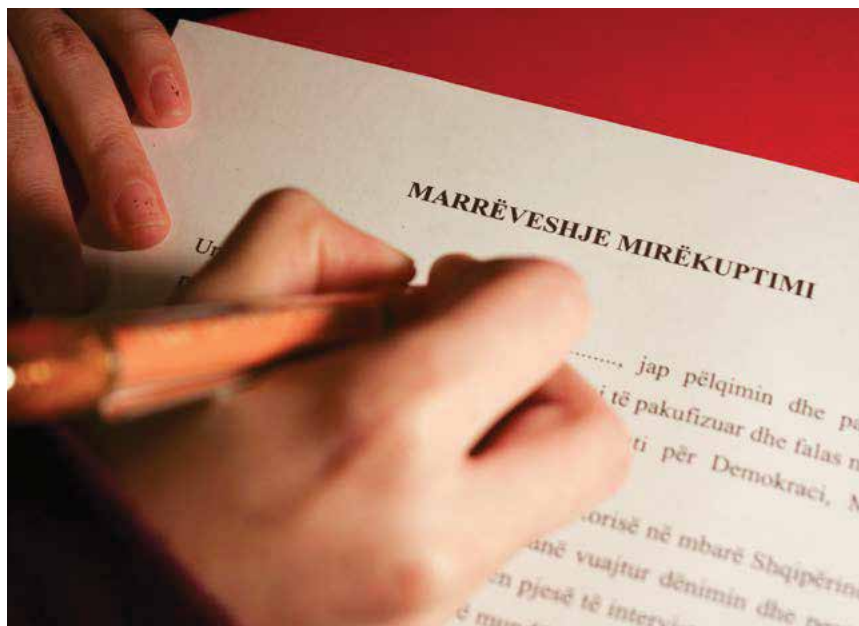
Një hap i rëndësishëm në procesin e historive gojore është përgatitja e marrëveshjes së mirëkuptimit.