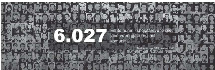
Figura 3 - Sipas ISKK numri i shqiptarëve që u vranë gjatë diktaturës ishte 6 027 persona.