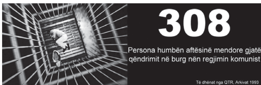
Figura 5 - Sipas ISKK 308 persona humbën aftësitë mendore duke u izoluar në burgje gjatë komunizmit.

Kriza globale ekonomike që përfshiu vendin në atë periudhë, nxiti qeverinë Berisha të ndryshonte procedurat e shpërblimeve duke i kthyer ato me tetë këste. Por vështirësitë financiare me të cilat përballej qeveria Berisha në vitet 2011-2012 bënë që pagesat e kësteve të dyta të ndërpriteshin për një pjesë të konsiderueshme ish-të përndjekurish. Ndërsa për disa të tjerë u abuzua me vlerësimin e “letrave me vlerë” të shpërndara në mesin e viteve 1990, ku shpesh ato u përllogaritën me një kurs fiks “1 lek vlerë nominale e bonos së privatizimit e barabartë me 1 lek kesh [në dorë]” 25 në një kohë kur bonot e privatizimit ishin zhvlerësuar totalisht që në vitet 1996-1999. Për rrjedhojë, qeveria i konsideronte