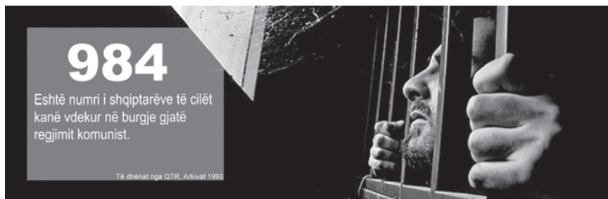
Figura 4 - Sipas ISKK numri i shqiptarëve që vdiqën burgjeve gjatë regjimit komunist ishte 984.