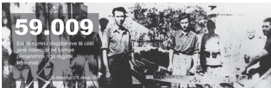
Figura 1 - Sipas ISKK numri i shqiptarëve që u internuan nga regjimi ishte 59 009 persona.