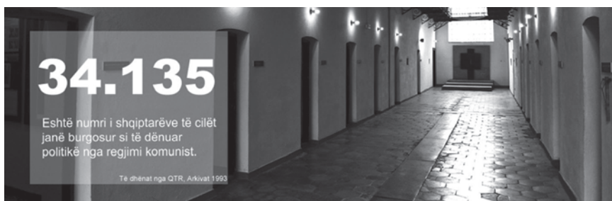
Figura 2 - Sipas ISKK numri i shqiptarëve që u burgosën gjatë diktaturës ishte 34 135 persona.